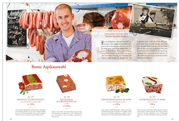
Salesfolder (Zielgruppe Fachhandwerk) für eine Wurst- und Schinken-Marke.