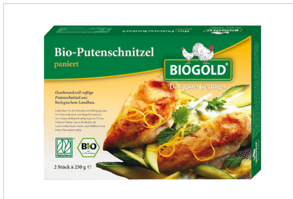
Markenentwicklung und Verpackungs-Design für eine Bio-Geflügel-Marke.